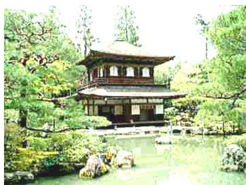
銀 閣 寺