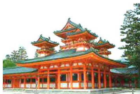
平 安 神 宮

近事研のホームページアドレスが変わりました。今後ともよろしく お願いします。 新アドレス http://www15.ocn.ne.jp/~kinjiken/